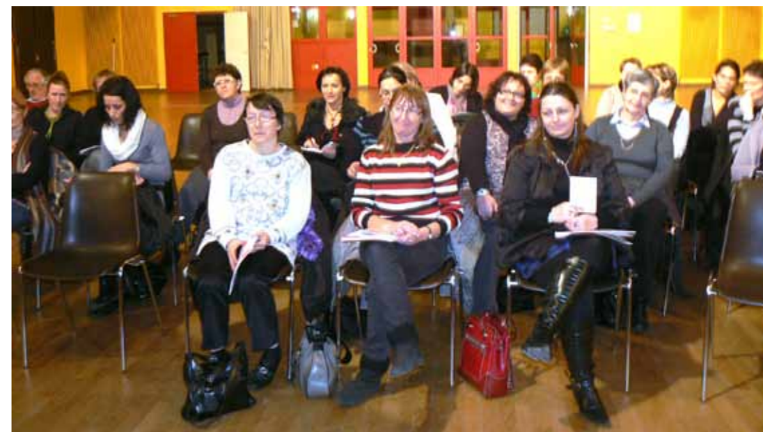
Assistantes maternelles qui ont participé à la soirée d'information les petits Maux de l'hiver en janvier