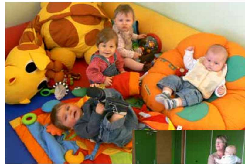
Le coin des câlins avec les tous petits