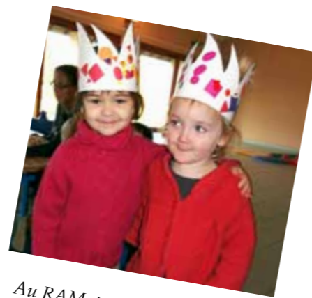
Au RAM, tous les enfants sont rois...